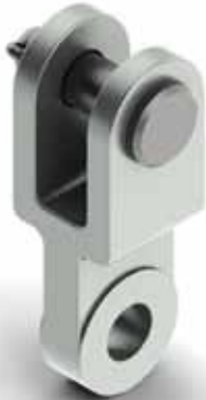
ADAPTADOR TIPO CLAVIS RECTO