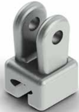
ADAPTADOR TIPO CUENCA Y LENGÜETA