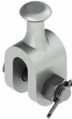
ADAPTADOR TIPO PASADOR Y BOLA